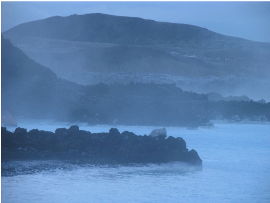
Få sekunders "klarhed", hvor jeg fik fornemmelsen af omgivelserne, som i disen til forveksling lignede landskaber jeg kender fra Japan