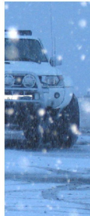
Det er hjul der dur

Her hører man konstant på vejruddsigterne for hele landet og de lokale områder. Fra det sekund vi tog af sted, blev det værre og værre. Så vi standsede nogle steder på vejen for at høre, hvad den