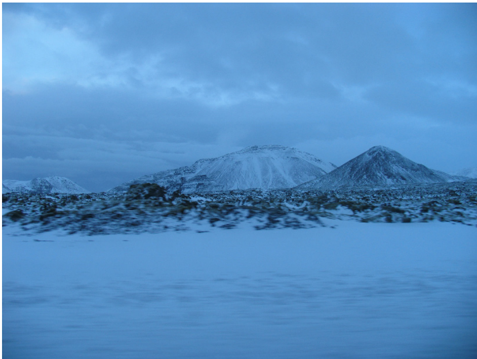
Det hele lukkede alt om os, Jord , himmel , bjerge kom tættere på, og det lynede!!!

men det er de, for de gengiver de dage, som jeg så dem, og jeg har aldrig tidligere oplevet så mange blå dage i hele mit liv.